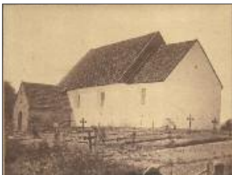
Uge Kirke fra sidst i 1800-tallet, før vinduerne mod syd blev skiftet.

Vi har nogle gamle kirkebygninger i vores sogne, der rummer mange spændende historier. I 2018 vil vi i de fire numre af KIMEN have en artikelserie, hvor vi fortæller Historier fra Kirkerne.