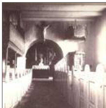
Kirkens indre før 1930, hvor orglet blev flyttet til den nuværende placering.