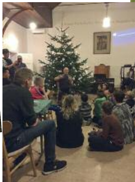
Julefest i Bolderslev missionshus med bugtaler og tryllekunstner

Tak til alle for deltagelse i vores fastelavngudstjeneste. Trods en kold dag med småregn, spiste vi pølser og slog katten af tønden.