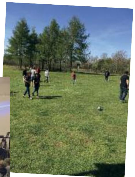
Teenklubben holdt Krolf-eftermiddag for bl.a. asylcentret, hvor der blev grillet og bagt pandekager m.m.